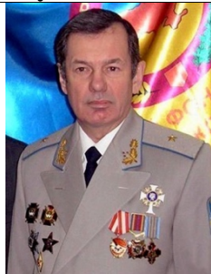
1993–1998 генерал-майор Раєвський